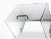
60 MLEPO 00