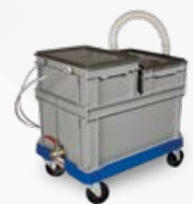
60 A0029 00