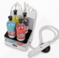
60 MLD00 00